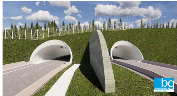
3D 4D 5D – BIM im Tunnelbau