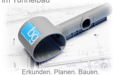
Erkunden. Planen. Bauen.